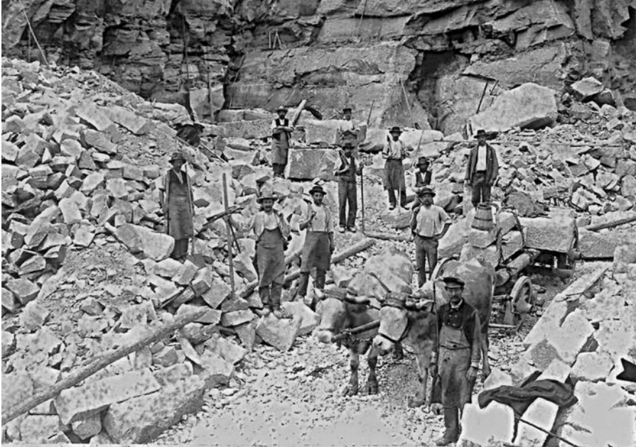
Italienische Arbeiter um 1907 in einem Steinbruch beim badischen Sulzbach.