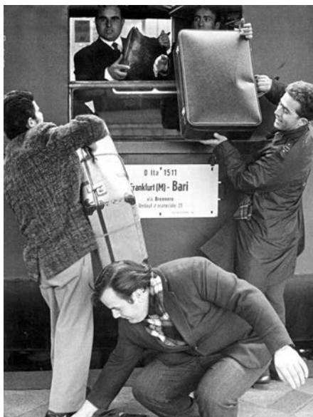
Ob an Bahnhöfen ...

Anfangs war die Welt der Gastarbeiter in Baden-Württemberg und anderswo in Deutschland ausschließlich männlich. „Zuhause“ wartete niemand: